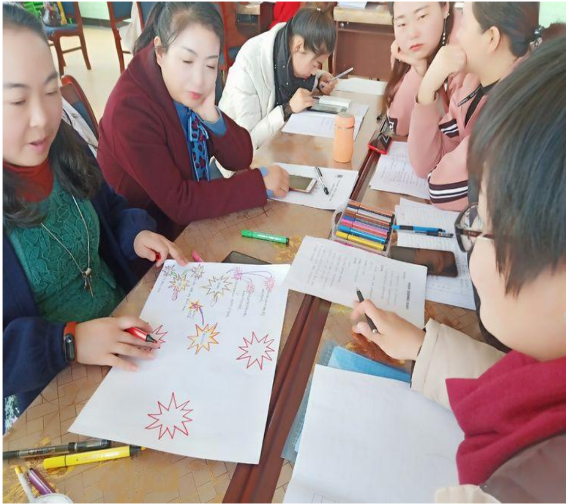
专家教师“手把手”指导教师如何评课